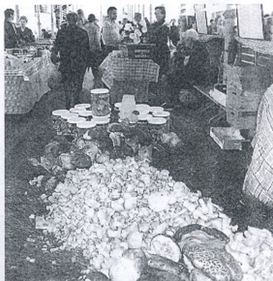
Preciosa imagen de hongos y zizas de un puesto. (ELI BELAUNTZARAN)

La oferta de panadería y bollería artesanal mantiene semana tras semana la lista de producto sin variar los precios. Hay bollos, magdalenas, pan artesanal sin aditivos químicos y cocido en verdaderos hornos de leña, pan de maíz, y un largo etcétera. Todos ellos se venden al precio que se estableció a principios de año y que no cambiará hasta el año que viene. Esfuerzo que hay que agradecer a los reposteros y panaderos que surten a los compradores de sus más exquisitas modalidades. ■